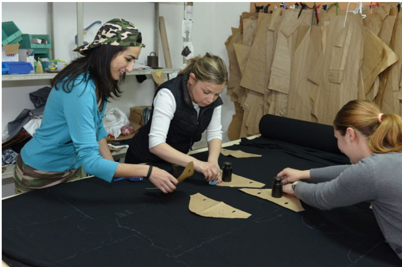
Mladi ljudi dizajniraju i proizvode modu u socijalno-odgovornom poduzeću u kojem se profiti reinvestiraju u projekte zajednice.

Inicijativa „Sporazum za rast i zapošljavanje“ koju je inicirala Evropska unija i koju su podržale međunarodne finansijske institucije 2014. godine je osigurala osnovu za jači fokus na reformama u cilju ekonomskog i socijalnog razvoja. Obzirom na Sporazum o stabilizaciji i pridruživanju, koji je stupio na snagu u junu 2015. godine, kao i usvojenu „reformsku agendu“ i naknadni akcioni plan u julu 2015. godine, veća pažnja se posvetila reformama koje se tiču povoljnog poslovnog okruženja, upravljanja javnim finansijama, tržišta rada, socijalne zaštite, vladavine prava i javne uprave. Kritična finansijska situacija u oba entiteta Bosne i Hercegovine je dovela do potpisivanja stand-by aranžmana sa Međunarodnim monetarnim fondom i Sporazuma o koordinacijskom mehanizmu kako bi se iskoristila pretpristupna sredstva koja pruža Evropska unija. Tokom zadnjih godina, investitori u nekretnine iz arapskih i zaljevskih država su u većoj mjeri prisutni u Bosni i Hercegovini, posebno u Sarajevu i okolici. Iako su investicije dobrodošle, pojavila su se pitanja i zabrinutost u vezi sa izvorima takvog kapitala, netransparentnih kupoprodajnih procedura u slučaju nekretnina i utjecaja strožijeg oblika islama koji se donosi u lokalne zajednice i društvo.