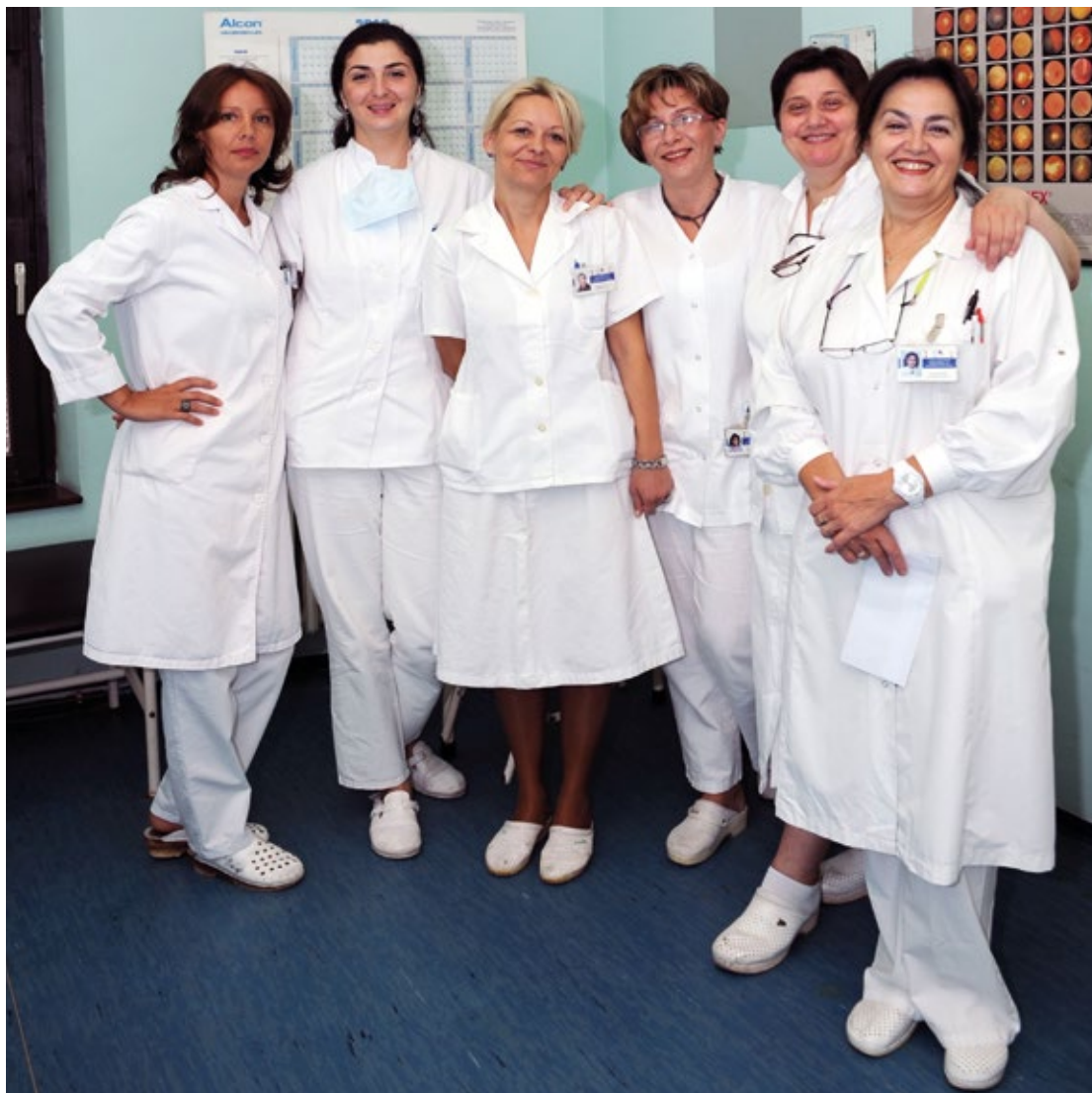
Medicinske sestre se obučavaju da pružaju sigurne i visokokvalitetne usluge stanovništvu širom Bosne i Hercegovine.