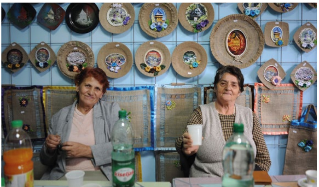
Okupaciona terapija pomaže osobama sa mentalnim poremećajima u obavljanju svakodnevnih zadataka i omogućava im da se integiraju u svoju zajednicu.

uspješno provode planiranje lokalnog razvoja su otvoreni za međuopćinsku i međuentitetsku saradnju; postoji vjerovatnoća da će njihovi projekti biti uspješni i postati održivi bez potrebe za dodatnom podrškom donatora. Parlament Federacije Bosne i Hercegovine je usvojio pravni okvir kojim se definira cjelokupni integrirani sistem upravljanja razvojem. Poboljšano općinsko i komunalno upravljanje, kombinirano sa određenim infrastrukturnim investicijama, je dovelo do višestrukih dodatnih investicija u istim sektorima. 23 općine su daleko uznapredovale u razvijanju procesa certificiranja općina sa povoljnim poslovnim okruženjem, čime će privući hitno potrebne investicije iz privatnog sektora u svrhu stvaranja radnih mjesta i povećanja javnih prihoda. Preko 200.000 građana je imalo koristi od ponovnog uspostavljanja pružanja javnih usluga koje je bilo prekinuto poplavama iz 2014. godine. Nove intervencije, kao što su mjere smanjenja rizika od katastrofa, su pripremljene za poboljšanje vodovodnog i kanalizacijskog sistema u dva grada sa preko 200.000 stanovnika. Uključivanje rodne ravnopravnosti je postao osnovni princip u novom Zakonu o strateškom planiranju Federacije Bosne i Hercegovine: preko 60% direktnih korisnika u određenim oblastima su sada žene.