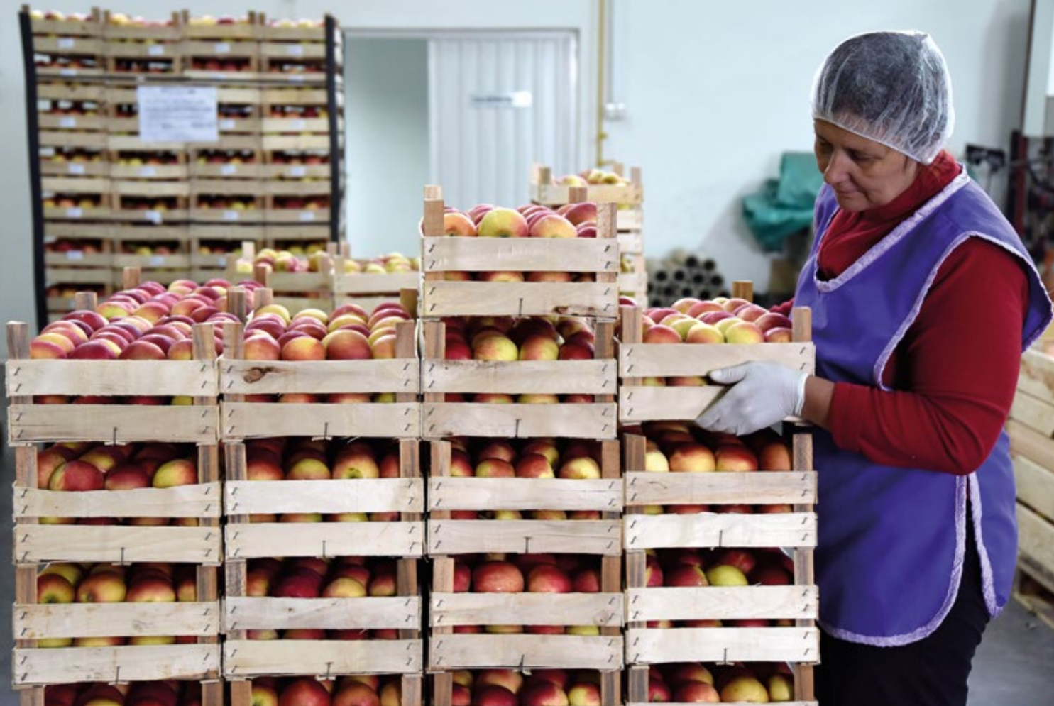
Uposlenica poljoprivrednog kolektiva u Gradačcu priprema lokalno proizvedene namirnice za isporuku jednom od najvećih tržišnih lanaca u regiji.

đanke i građane. Ovaj rad je dopunjen aktivnostima koje se odnose na korporativnu odgovornost i certifikaciju mikrofinansijskih institucija. Uprkos nedovoljno funkcionalnom tržištu rada u Bosni i Hercegovini, više od 3.000 mladih ljudi se zaposlilo tokom prošle tri godine kao direktan rezultat inicijativa koje je podržala Švicarska. Uvođenje usluga savjetovanja za mlade osobe koje traže zaposlenje je dio šire reforme koju uspješno provode službe za zapošljavanje. Jača posvećenost privatnog sektora pri pružanju dostojanstvenih prilika za zapošljavanje i osiguravanje prostora za razvoj relevantnih vještina je postignuta, a preko 80 poslodavaca je učestvovalo u izradi trening programa za neformalne obuke u različitim industrijskim oblastima. Sve više poslodavaca se povezuje sa školama i spremni su ponuditi praktičnu obuku ili prilike za stažiranje za mlade osobe u svojim kompanijama. Uvođenje vještina orijentiranih prema tržištu rada u stručnu obuku, kombinirano sa mentorstvom i posredovanjem pri zapošljavanju, dovodi do povoljnih osnova za uspješne start-up kompanije u obećavajućim sektorima poput informacijskih tehnologija i turizma. Nadalje, razvoj socijalnih poduzeća kako bi se, na primjer, ponudila mogućnost zaposlenja osobama sa invaliditetom, testiran je uz obećavajuće rezultate. Svi ovi opipljivi rezultati su stvorili nove prilike za politički dijalog sa nadležnim ministarstvima, što je dovelo do važnih promjena zakonskog i regulatornog okvira.