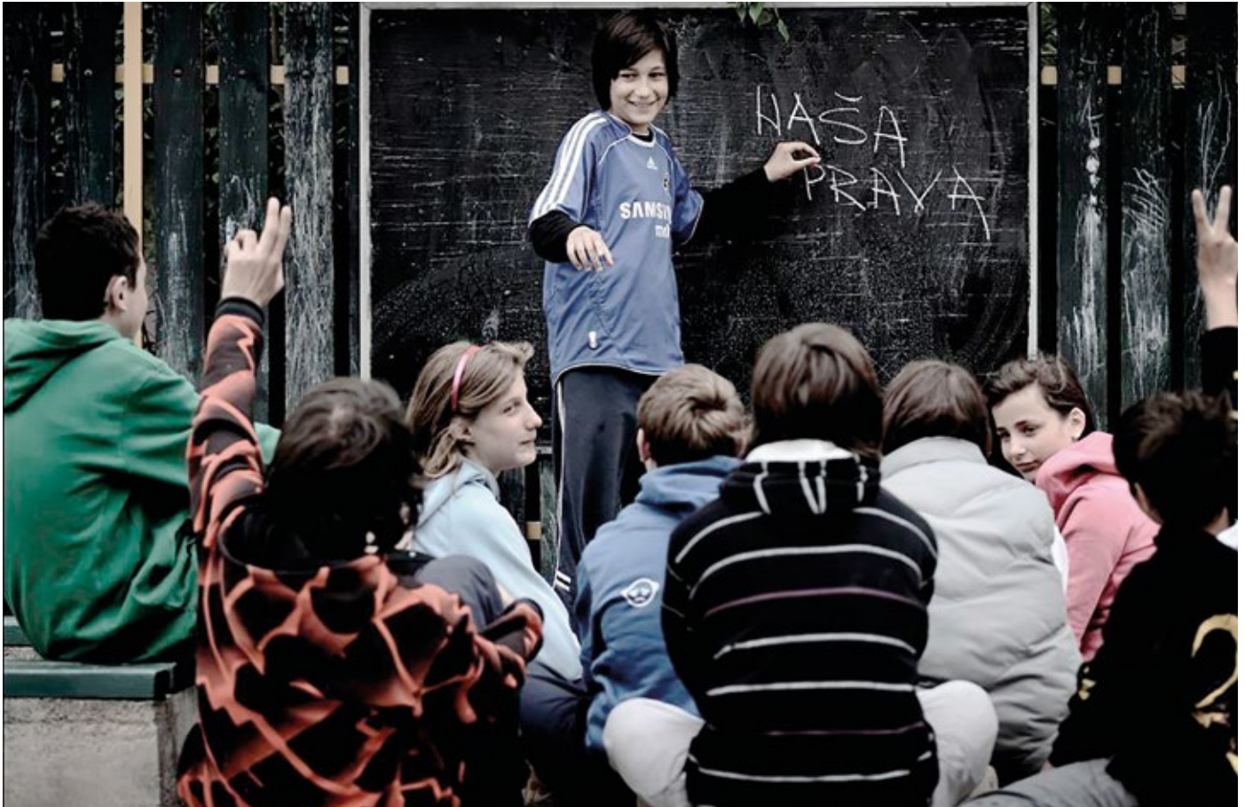
Djeca i mladi u Bosni i Hercegovini uče kako da na miroljubiv način zahtijevaju svoja prava ("naša prava").